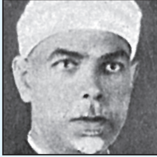
أ.د. محمد عبدالله دراز (*)

عن أنس -رضي الله عنه- قال: قال رسول الله ﷺ: «ثلاثٌ من كُنَّ فيه وجد حلاوة الإيمان: أن يكون الله ورسوله أحبَّ إليه مما سواهما، وأن يحب المرء لا يحبه إلا لله، وأن يكره أن يعود في الكفر كما يكره أن يُقذف في النار» (أخرجه الخمسة إلا أبا داود) (١) .